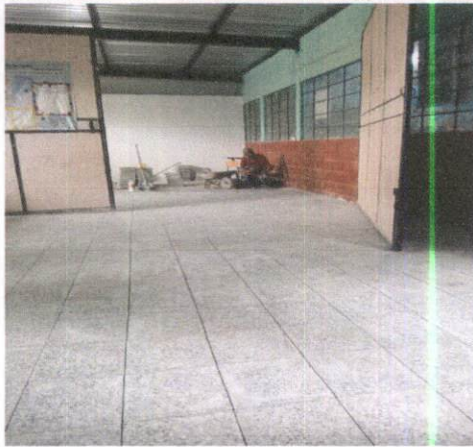
Foto 3: Finalización de instalación de piso de granito en las aulas de Preprimaria.