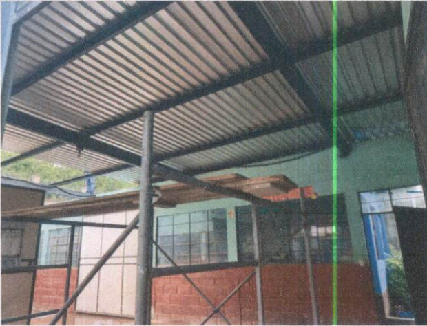
Foto1: Finalización de cubierta de lámina en las aulas de Preprimaria.