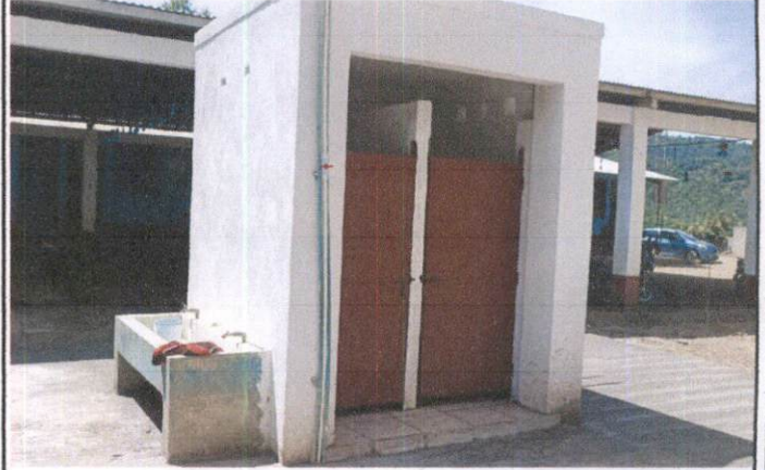
Foto 2: Trabajo finalizado de reparación de servicios sanitarios y reparación de drenajes.